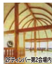
2Fティンバー第2会場内