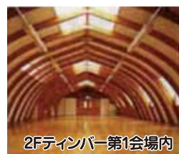
2Fティンバー第1会場内