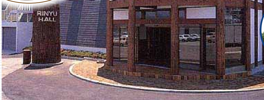
林友渚カナデアンホール