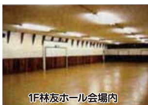
1F林友ホール会場内

その他備品の貸出及び外注手配(有料)も承ります。 詳しくはお気軽にお問い合わせください。